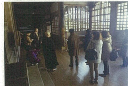
台湾のメディア招請例 (永平寺(永平寺町)の視察)