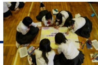
高校でのライフデザインワークショップの様子