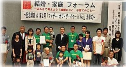
第1回「ファザー・オブ・ザ・イヤーinみえ」表彰式の様子