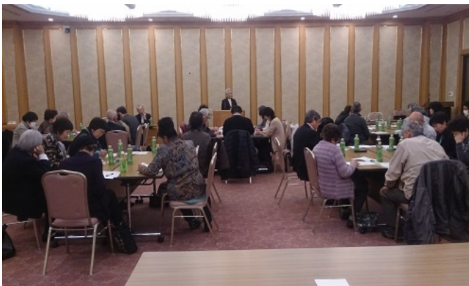
マリッジサポーターの広域交流会の様子