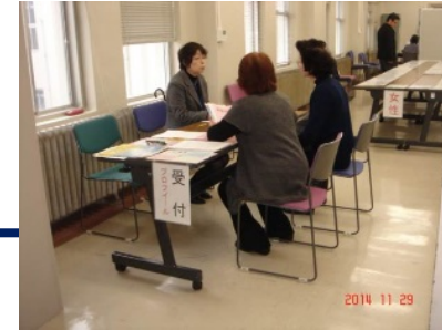
マリッジサポーターによる草の根よろず相談会の様子

マリッジサポーターのスキルアップの成果を活かし、結婚に関する悩みを持つ人を対象に、市町村と連携の上で、各地域で独身者やその親等を対象とした相談会を実施