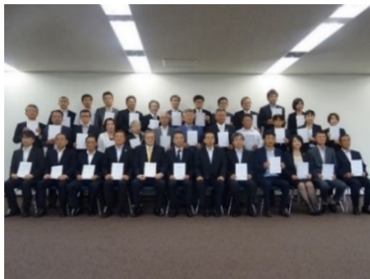
第1回ふくい結婚応援登録証交付式(H27.9.7)