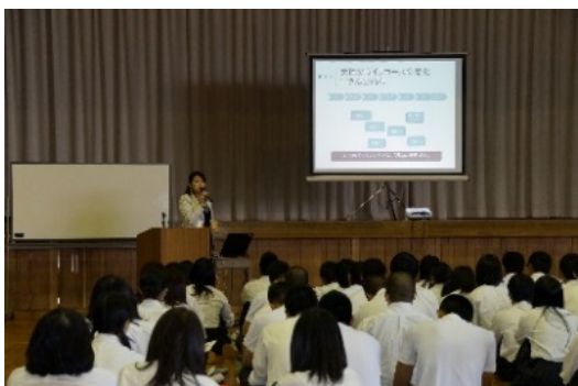
高校でのライフデザインセミナーの様子

※ H27年度補正予算以降の実施においては、事業の成果として、ここに記載された項目のみならず、セミナー受講者のうち実際にライフデザインを描いた者の割合についてもKPIとして求めることとしています。4